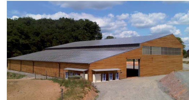
249 KWc - Cantal