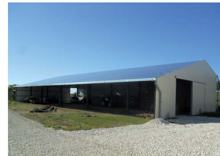
99 KWc - Gers

Sur la base des centrales suivies actuellement