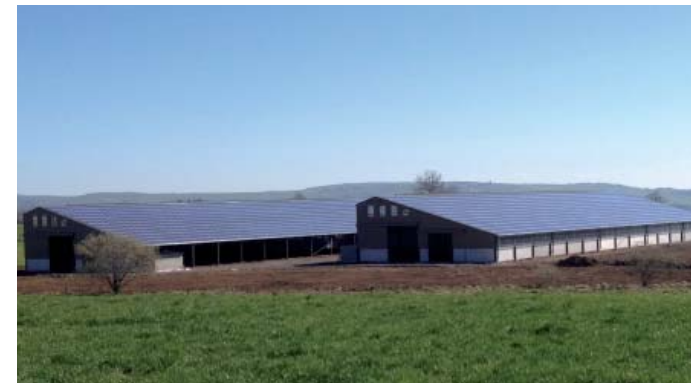
2 x 243 KWc - Aveyron