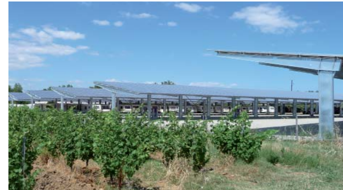
786 KWc - Hérault