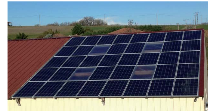
9 KWc - Haute-Garonne